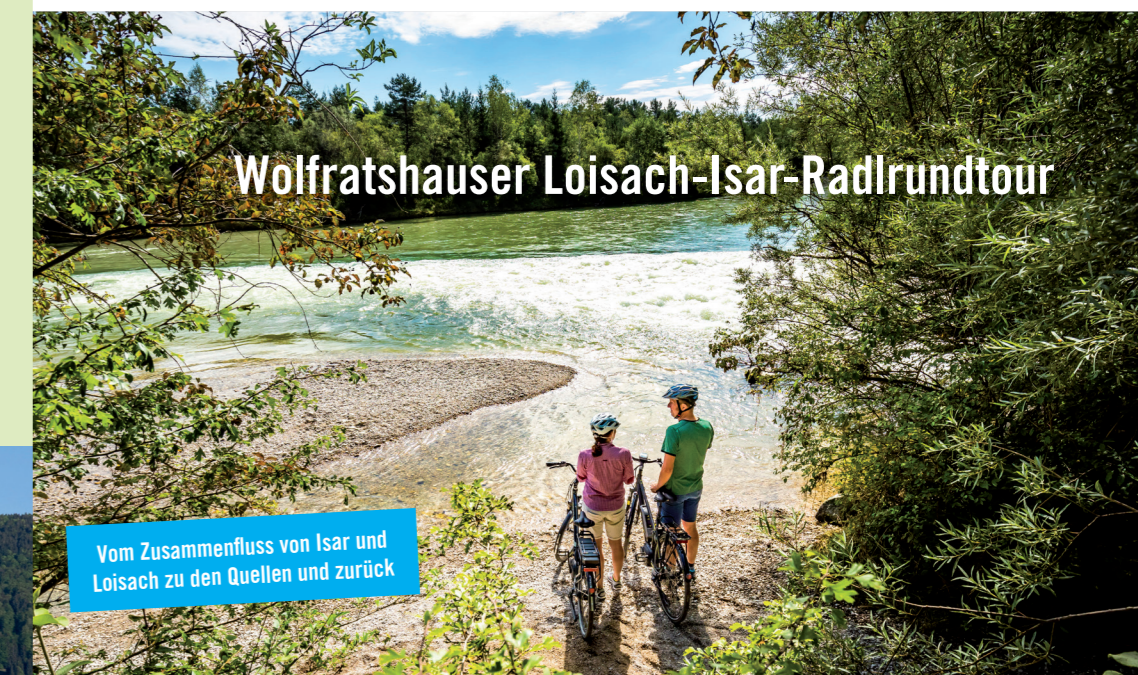
Vom Zusammenfluss von Isar und Loisach zu den Quellen und zurück

Mehrtägige Genussradrunde entlang den malerischen Flüssen Loisach und Isar. Einer der Höhepunkte ist sicherlich die Umrundung der Zugspitze. Auf der gesamten Strecke eröffnet sich ein überwältigendes Natur- und Bergpanorama. Je nach Etappeneinteilung bietet die Runde Abwechslung für den sportlichen, aber auch für den genussorientierten Radfahrer.