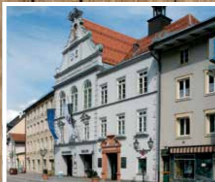
Drehort Rathaus Stadt Wolfratshausen