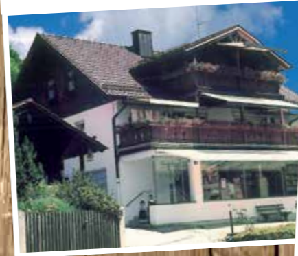
Drehort Bäckerei Café GRAF – der „Rattlinger“.

Die herrliche Lage nahe des Starnberger Sees bewog wahrscheinlich die ersten Iringer die alte Iringsburg im Loisachtal zu errichten. Die Hofmark der Iringer – die der Gemeinde den Namen gab – reichte von Herrnhäusern bis zum Starnberger See und von Wolfratshausen bis an das Gebiet des Klosters Benediktbeuern. Das Wappen der Gemeinde resultiert aus der Gründung Eurasburgs und des Augustinerklosters in Beuerberg. Seit der Gebietsreform von 1978 beträgt die Fläche der Gemeinde Eurasburg, die aus 52 Ortsteilen besteht, 40,9 qkm.