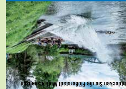
Entdecken Sie die Flößerstadt Wolfratshausen

Broschüre Wandertipps Wolfratshausen Die Touren sind besonders für Familien oder auch für Wanderer geeignet, die es etwas „gemühtlicher“ bevorzugen. Broschüre ist in der Tourist-Info im Rathaus Wolfratshausen erhältlich.